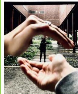
Gestaltung? Design? Ku...