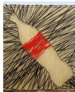
Holz, Druck, Comic & Co