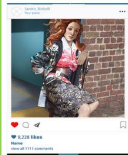
Hipsters of Instagram